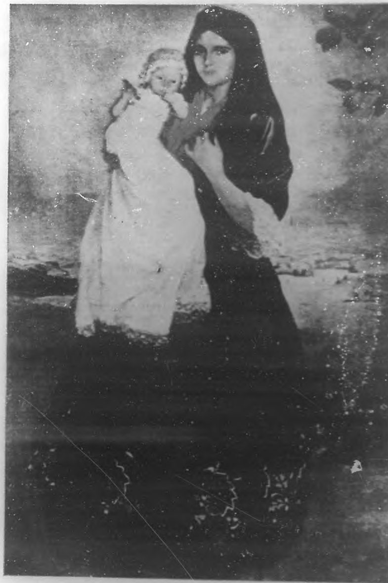
HACIA EL NIDO

Barca de Caronte que pasas y pasas a cada momento por mi vera franca cual siniestro aviso de la eterna sombra que nos amenaza, yo tengo un suspiro para cada muerto, para cada muerto que a mí vera pasas, y tengo en mis ojos amargas tristezas y gotas de agua.