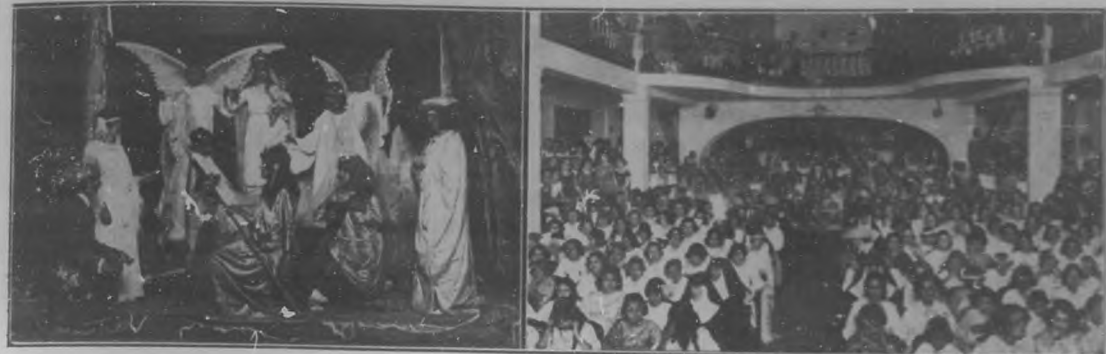
A la izquierda.—Uno de los números más interesantes de la fiesta celebrada en el "Gran Cinema", por las alumnas del colegio "Nuestra Sra. de Lourdes".—A la derecha:—Aspecto general de la concurrencia que asistió a la repartición de premios a las alumnas del colegio "Nuestra Sra. de Lourdes", de las Madres Felipenses, acto celebrado en el "Gran Cinema", de la Vibora.

sociedad, las cuales contribuyeron con su presencia al mayor realce de la fiesta.